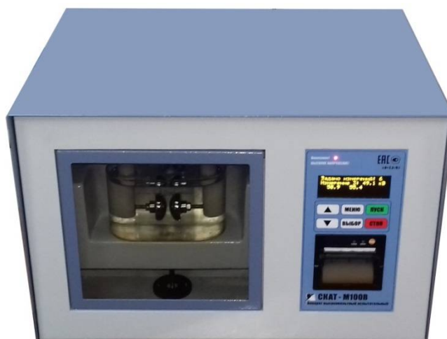
Рис.1 Внешний вид SKAT-M100B

Внешний вид аппарата приведен на рисунке 1