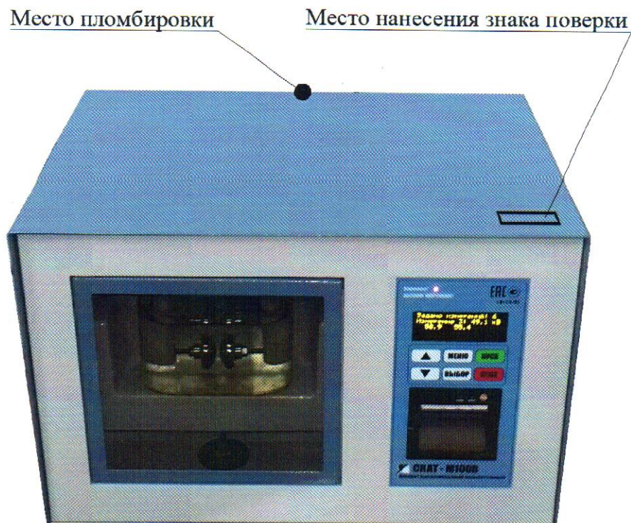
Рисунок 1 - Общий вид аппаратов высоковольтных испытательных СКАТ-М100В

Общий вид аппаратов высоковольтных испытательных СКАТ-М100В с указанием места пломбировки и места нанесения знака поверки представлен на рисунке 1.