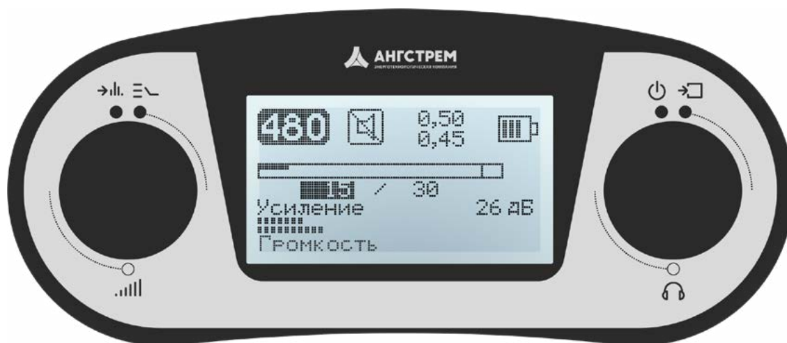
Рис. 1 – Передняя панель приемника ПП-500К

*** – минимальная полоса пропускания в процентах к центральной частоте в режиме Узкая Полоса (УП).